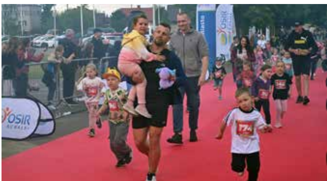
Najmłodszy bieg na dystansie 200 metrów (niektórzy razem z rodzicami) i wszyscy byli zwycięzcami

W drugim dniu imprezy 13 czerwca, odbyły się Biegi Pełne Energii (dla dzieci i młodzieży) na krótkich dystansach.