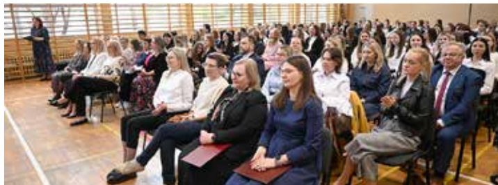
Wręczenie świadectw dla uczniów Zespołu Szkół nr 4 odbyło się z przyczyn technicznych (budowa nowej sali sportowej) u sąsiadów czyli w Zespole Szkół Technicznych

24 kwietnia 861 abiturientów suwalskich szkół średnich (w tym 550 uczniów liceów i 311 z technikum), którzy zostali dopuszczeni do egzaminu maturalnego i zamierzają go zdawać, odebrało świadectwa ukończenia swoich szkół.