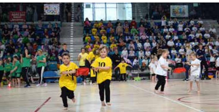
Małym sportowcom kibicowali ich koledzy i koleżanki z przedszkoli oraz rodzice

To był dzień pełen ruchu, uśmiechu i sportowych emocji. 23 kwietnia w Suwałki Arenie rywalizowały dzieci ze wszystkich suwalskich przedszkoli samorządowych, oddziałów przedszkolnych przy Szkołach Podstawowych nr 10 i nr 11 oraz Niepublicznego Przedszkola „Zielony Zakątek”. Olimpiada ma zachęcić najmłodszych do zabaw sprawnościowych, rozwijania ogólnej sprawności fizycznej i umiejętności sportowych, a także wspierania różnych form aktywności ruchowej. Wszyscy jej uczestnicy otrzymali pamiątkowe medale. Zawody zorganizowało Przedszkole nr 8. Gośćmi oraz współprowadzącymi byli siatkarze Ślepska Małow oraz piłkarze Wigier.