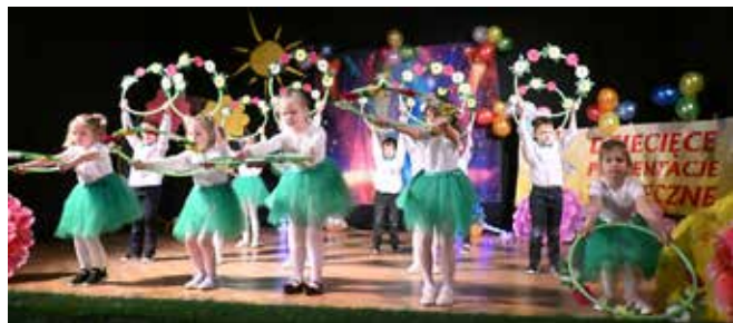
Dzieci z grupy Zajęczki z suwalskiej Szkoły Podstawowej nr 7

Już po raz szesnasty dzieci z 13 przedszkoli z Suwałk, Augustowa i Sejn oraz oddziału przedszkolnego w Szkole Podstawowej nr 7 spotkały się, by wspólnie tańczyć i bawić się podczas kolejnej edycji Dziecięcych Prezentacji Tanecznych. Na scenie w auli SP nr 7 im. św. Jana Pawła II zaprezentowało się aż 155 młodych tancerzy.