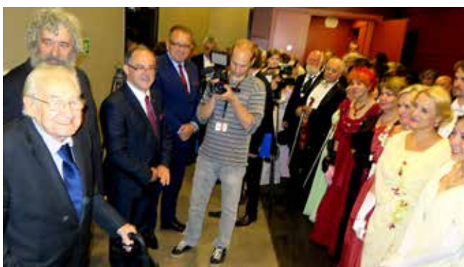
Andrzej Wajda obejrzał też widowisko taneczno-teatralne „Bal w Resursie Obywatelskiej” w wykonaniu Zespołu Pieśni i Tańca „Suwalszczyzna”, za które podziękował członkom zespołu