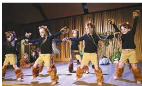
„Taniec na łwiej skale” odtanńczyły przedszkolaki z „ósemki”

Na zakończenie spotkania na scenie, młodzi artyści odśpiewali piosenkę „Witajcie w naszej bajce” z filmu „Akademia Pana Kleksa”. Wszyscy uczestnicy gali zostali nagrodzeni statuetką, słodyczami oraz gromkimi brawami.