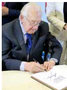
16 czerwca 2016 r. Andrzej Wajda dokonał ostatniego wpisu skierowanego do Suwałczan