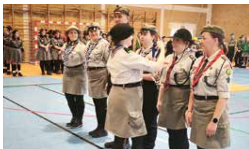
Wyróżniający się instruktorzy suwalskiego Hufca ZHP im. T. Lutostańskiego otrzymali wyróżnienia

Po mszy św. w konkatedrze pw. św. Aleksandra uczestnicy przemaszewali do sali gimnastycznej II Liceum Ogólnokształcącego im. gen. Z. Podhorskiego, gdzie podczas apelu wręczono hufcowe wyróżnienia, listy pochwalne oraz okolicznościowe gawerfony. Wszystko zakończyło się integracyjnym spotkaniem środowiskowym.