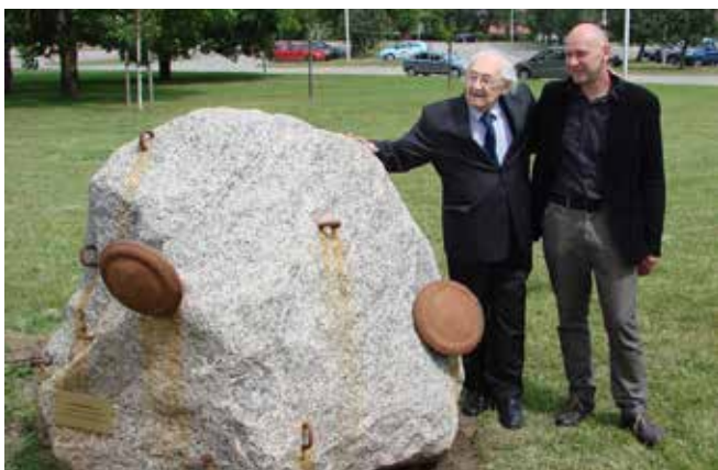
Andrzej Wajda odsłonił też rzeźby z pleneru poświęconego życiu i twórczości reżysera przy ul. Zarzecze 26 w sąsiedztwie stadionu piłkarskiego. Na zdjęciu z Algisem Kasparavičiusem, autorem rzeźby pt. „Zostaną po nas tylko guziki”