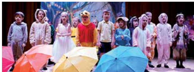
Przedszkolaki z „czwórki” zaprezentowały swoją wersję „Kubusia Puchatka”

26 lutego, po raz kolejny w Państwowej Szkole Muzycznej I i II st., odbyła się Gala Teatrów Przedszkolnych „Muzyczny Świat Walta Disneya”. Organizatorem spotkania było suwalskie Przedszkole nr 1. Na galę przybyli liczni goście, w tym najwerniejsi widzowie – rodzice i dziadkowie występujących dzieci. Uroczystość poprowadzili bajkowi konferansjerzy. Dzieci z suwalskich przedszkoli zaprezentowały spektakle muzyczno-taneczne do utworów z bajek Disneya.