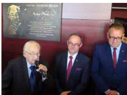
Nadanie Sali Koncertowo-Teatralnej Suwalskiego Ośrodka Kultury imienia Andrzeja Wajdy

nięcie w Suwalskim Ośrodku Kultury pamiątkowej tablicy oraz nadanie Sali Koncertowo-Teatralnej imienia Andrzeja Wajdy w 90 rocznicę urodzin artysty.