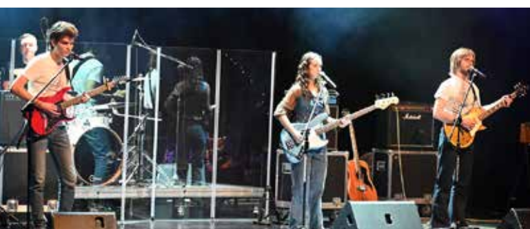
Na zakończenie gali rockowy koncert zagrał młodzieżowy zespół RUSTY DUSTY