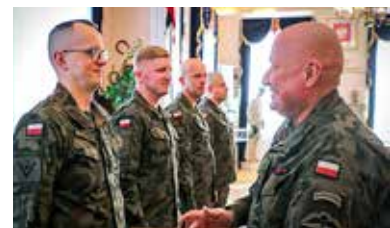
Fot. 14 Suwalski Pułk Przeciwpancerny

● Dowódca Generalny Rodzajów Sił Zbrojnych, gen. broni Marek Sokółowski złożył wizytę w 14 Suwalskim Pułku Przeciwpancernym.