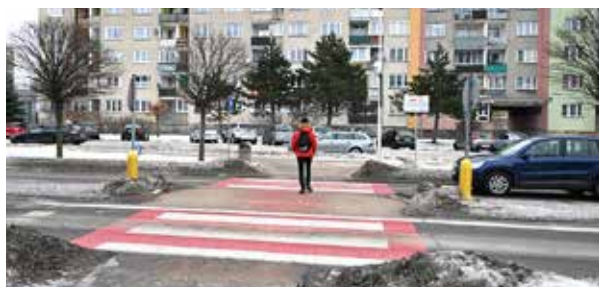
Pierwsze aktywne przejście dla pieszych z nowoczesnym oświetleniem powstało przy ul. T. Noniewicza

– Dzięki pozyskanyim środkom zewnętrznym możemy wdrażać nowoczesne rozwiązania, takie jak aktywne przejścia czy dedykowane oświetlenie LED, które eliminują tzw. „czarne punkty” na mapie miasta – stwierdził prezydent Suwałk Czesław Renkiewicz.