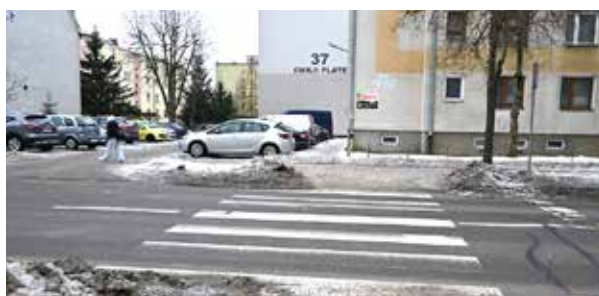
Z przejścia dla pieszych na ul. E. Plater przy bloku nr 41A korzystają przede wszystkim mieszkańcy Osiedla I oraz osiedla przy ul. E. Plater. Mieszka tu wielu starszych Suwalczan. Po przebudowie przejście będzie wyposażone w nowoczesne oświetlenie, które ma poprawić bezpieczeństwo pieszych po zmroku

Przetarg na doświetlenie 10 przejść dla pieszych obejmuje następujące lokalizacje: ul. Papieża Jana Pawła II (przy Aquaparku), ul. T. Noniewicza (przy DH Wigry), ul. T. Kościuszki (trzy przejścia na wysokości posesji nr 83, 69 i 39), ul. A. Putry (przy bloku nr 3), ul. gen. W. Andersa (przy skrzyżowaniu z ul. A. Wierusza-Kowalskiego), ul. A. Wierusza-Kowalskiego (przy skrzyżowaniu z ul. gen. W. Andersa) oraz dwa przejścia na ul. E. Plater (przy blokach nr 41A i 7).