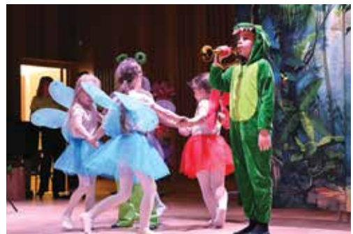
Najmłodszy z Przedszkola nr 6 śpiewająco, tanecznie i kolorowo zaprezentowały przedstawienie pt. „Człowiekiem gdybym był”