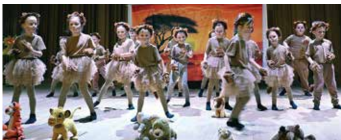
„Strasznie już być tym królem chcę” w wykonaniu przedszkolaków z „siódemki”