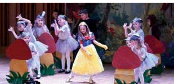
Dzieci z Przedszkola nr 1 przedstawiły spektakl taneczno-wokalny „Śnieżka”