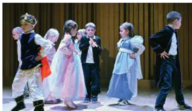
Bał na królewskim zamku, czyli „Kopciuszek” w wykonaniu dzieci z Przedszkola nr 3