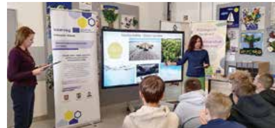
Warsztaty ekologiczne z młodzieżą w Ałytusie w ramach projektu „Współpraca proekologiczna”