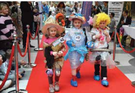
Festival Eko Wizja 5, który odbył się 14-15.11.2025

Miasto Suwałki wraz z partnerami z Litwy finalizuje realizację projektu nr LTPL00041 pn. „Współpraca proekologiczna” (ang. „Green Minded Cooperation”) w ramach Priorytetu 1 –