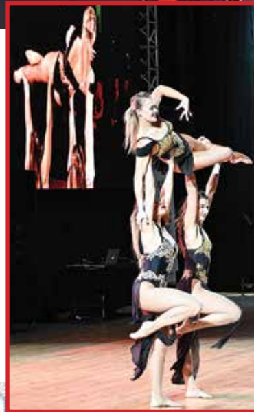
Pokaz tańca akrobatycznego zaprezentowało trio INFINITY GROUP, znane z programu telewizyjnego „Mam Talent”