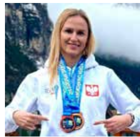
Fot. FB M. Bielawska

M. Bielawska zdobyła dwa medale: złoty na 100 m w stylu motylkowym i brązowy na 50 m w stylu motylkowym.