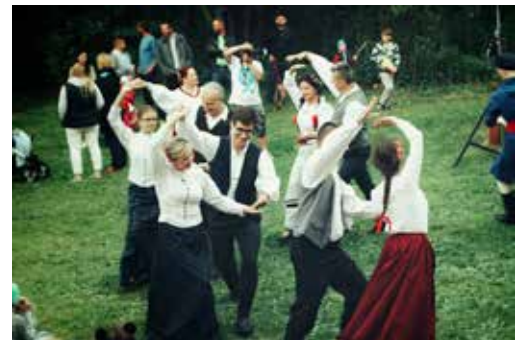
„Noc Świętojańska” z zespołem Pieśni i Tańca Suwalszczyzna Fot. archiwalna z 2018 r.

Są też działania SPK skierowane bezpośrednio do mieszkań-