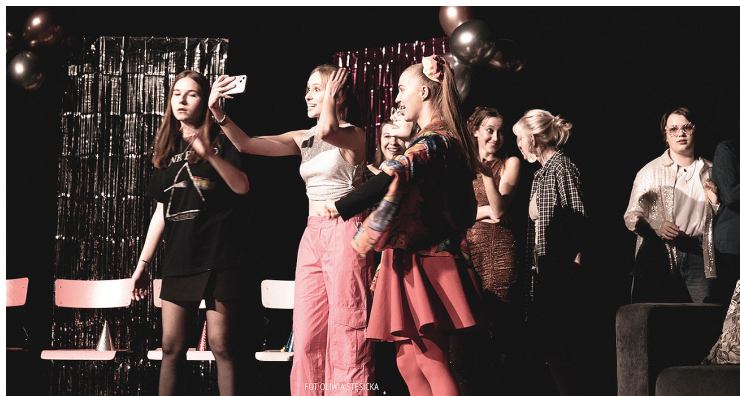
Impreza, problemy, historie ludzi młodych. Wspominanie tego, co mogło być. Rozmyślanie o tym, co może być warte ciągle uciekającego „time'u” czyli „Showtime” w wykonaniu Teatru Form Czarno-Białych „Plama”

W czasie spotkań „WTOOPA” zaprezentowano osiem spektakli, w tym dwa przygotowane przez suwalskie grupy. Teatr Form Czarno-Białych „Plama” zagrał spektakl „Showtime”, a Teatr Hybrydowy zaprezentował „Wszystko się chwije według Mistrza Ildefonsa”.