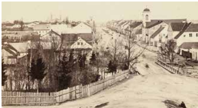
Zdjęcie Antoniego Sadowskiego z widokiem na główną ulicę Suwałk i kościół ewangelicki w 1868 r.