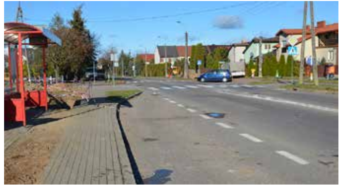
Przy ul. Powstańców Wielkopolskich rozpoczęły się prace ziemne na chodnikach wzdłuż jezdni

Ponadto w związku z remontem ul. Kolejowej, od 4 listopada są utrudnienia w ruchu drogowym na tej ulicy oraz obowiązuje zamknięcie skrzyżowania u zbiegu ulic: Kolejowej-Grabowej-Topolowej. Suwański ZDiZ prosi kierowców oraz pieszych o zachowanie szczególnej ostrożności i zastosowanie się do wprowadzonego oznakowania oraz przeprosza za utrudnienia.