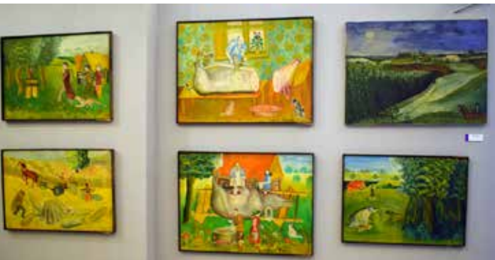
Konferencjom towarzyszyła wystawa „Sztuka ludowa Suwalszczyzny”, którą w suwalskim Muzeum Okręgowym można oglądać do końca tego roku