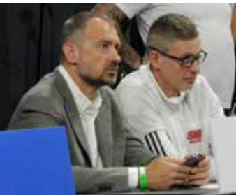
Mecz z ZAKSA w Suwałki Arenie obserwował trener reprezentacji Polski w siatkówce Nikola Grbić

Suwańska drużyna z 8 pkt. zajmuje dziesiątą lokatę w tabeli PlusLigi. W następnej kolejce Ślepsk Małow rozegra w Suwałki Arenie niezwykle ważny mecz ze Stalą Nysa. Wynik tego spotkania może mieć duże znaczenie w walce o zajęcie bezpiecznego miejsca w tabeli. Początek spotkania 25 października (piątek) o godz. 20:30.