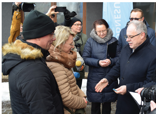
26 stycznia tego roku klucze do swoich mieszkań wybudowanych w formule „Od najemcy do właściciela” odebrali lokatorzy budynku przy ul. Rodziny Rylskich

Pierwszym i bardzo istotnym wyzwaniem suwalskiego samorządu na kolejną kadencję będą sprawy demografii miasta i działań, które należy podjąć, by zahamować lub co najmniej ograniczyć negatywne trendy. Chcemy uruchomić szereg instrumentów, by powstrzymać odpływ mieszkańców do ościennych gmin oraz zachęcić młodych ludzi studiujących w dużych ośrodkach miejskich do powrotów do naszego miasta i do osiedlania się w Suwałkach. Będziemy finansowali jako samorząd wraz z przedsiębiorcami stypendia dla studen-