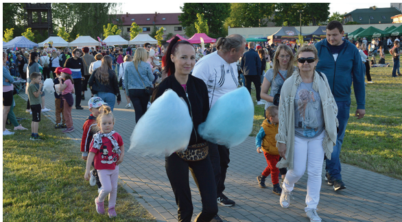
Oblegane były stoiska gastronomiczne, a zwłaszcza z napojami, watą cukrową i różnymi „odpustowymi” gadżetami. Dla najmłodszych zorganizowano strefy zabaw