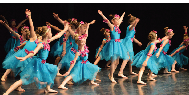
Zespół Perły z Pracowni Sztuki Suwałki

Blisko 600 młodych tancerzy i piosenkarzy z kilku krajów oraz Polski wystąpiło na 24 Międzynarodowym Festiwalu „Muszelki Wigier”. Jest to dla nich szansa na zaprezentowanie się przed publicznością. Najlepsi w kategoriach taniec i śpiew otrzymali złote, srebrne i brązowe Muszelki Wigier. Części konkursowej towarzyszyły zajęcia warsztatowe prowadzone przez znanych i cenionych choreografów, trenerów wokalnych i reżyserów koncertów oraz spotkania integracyjne. Organizatorem festiwalu była Fundacja Na Rzecz Rozwoju Społecznego.