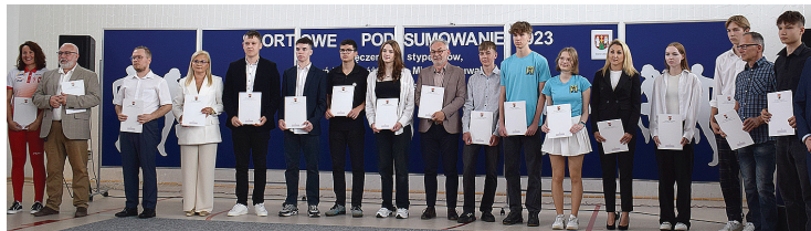
Dwadzieścia nagród odebrali zawodnicy i ich opiekunowie, którzy osiągnęli sukcesy w: kajakarstwie, badmintonie, pływaniu, karate, lekkoatletyce, szachach, żeglarstwie i taekwondo