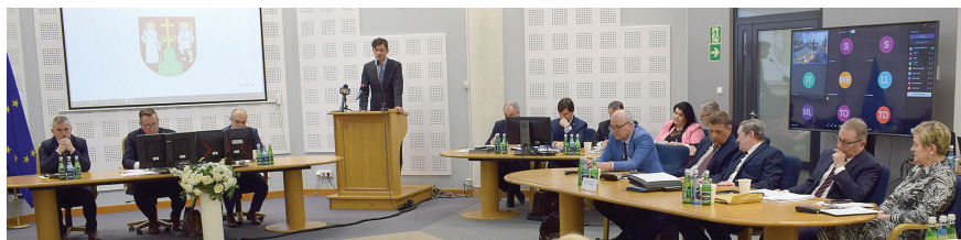
27 marca stanowisko w obronie „Roty” i M. Konopnickiej jednogłośnie przyjęli suwalscy radni miejscy

i każdy nauczyciel mógł wybrać inny wiersz Konopnickiej, ale zawsze Rota mogła i dalej może być omawiana na lekcji.” Fakty są takie, że wiersz „Rota” napisała M. Konopnicka