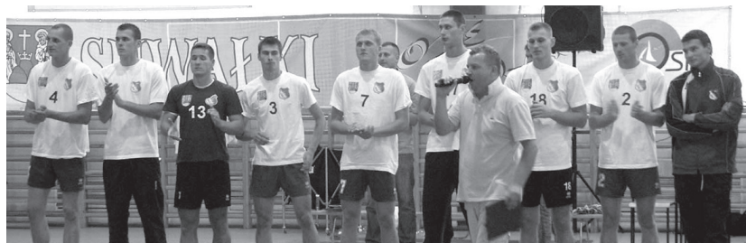
Pierwszoligowi siatkarze Ślepska podczas prezentacji przed rozpoczęciem sezonu 2009-2010

– Miejski Klub Sportowy Ślepsk Małow Suwałki funkcjonuje na rynku jako spółka z ograniczoną odpowiedzialnością. Klub posiada Radę Nadzorczą i Zarząd, którzy „ramię w ramię” z gronem Wspólników, podejmują wszystkie kluczowe dla istnienia jednostki decyzje. Swoje działania opierają na rozmowie i wzajemnym zrozumieniu. Podobnie wygląda sytuacja współpracy klubu z partnerami. Zależy nam na tym, aby wszyscy czuli się zaopiekowani i potrzebni – bo razem możemy więcej. To hasło doskonale wkomponowało się w naszą klubową filozofię i prowadzi nas niemal przez wszystkie aspekty codziennego życia Ślepska Małow Suwałki. Kierujemy się