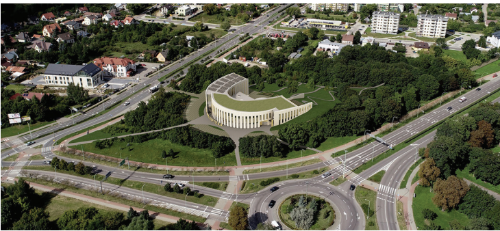
Wizualizacja Mediateki pomiędzy ul. M. Reja i gen. K. Pułaskiego

– Pomimo podjętej we wrześniu 2022 r. przez Radę Miejską w Suwałkach uchwały w zakresie realizacji tego przedsięwzięcia inwestycyjnego, czyli Mediateki, nadal trwają dyskusje co do zasadności tej inwestycji. Zamierzam w związku z tym zasięgnąć opinii samych mieszkańców poprzez szerokie i pogłębione konsultacje społeczne. Potrzebna jest też rzetelna informacja dla mieszkańców. Dlaczego chcemy ten obiekt realizować, co nas czeka, gdy nie będziemy go budowali, jakie ponieśliśmy już koszty i jakie samorząd będzie zmuszony ponieść, gdyby odstąpiono od realizacji tej inwestycji? Zamierzam rozpocząć konsultacje społeczne w terminie nie później niż do połowy czerwca tego roku. Trzeba też mieszkańcom wyjaśnić, iż zdecydowana większość środków finansowych na budowę Mediateki jest już Suwałkom przyznana z funduszy unijnych w kontrakcie programowym zawartym pomiędzy rządem i władzami województwa podlaskiego. Ale ostateczny głos, co do budowy tego obiektu należeć będzie do Suwałczan.