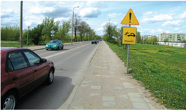
Ulica M. Reja w 2007 roku przed przebudową

Od 2004 r. do suwałckiego samorządu trafiło ok. 563 mln zł z funduszy unijnych, za które zrealizowano 99 projektów na łączną kwotę prawie 921 mln zł. Za te pieniądze zrealizowano szereg działań społecznych i inwestycji w mieście. Najwięcej zmieniło się na suwałckich drogach. Z pieniędzy unijnych dofinansowano przebudowę kilkudziesięciu suwałckich ulic, w tym m.in.: Grunwaldzkiej, gen. W. Sikorskiego, Bakałarzewskiej, 24 sierpnia (z mostem), Wigierskiej, Leśnej, Armii Krajowej, 100-lecia Niepodległości, rot. W. Pileckiego i Sejneńskiej. Ale pierwszą i najbardziej wyczekiwaną przez suwalczan była przebudowa ul. Mikołaja Reja.