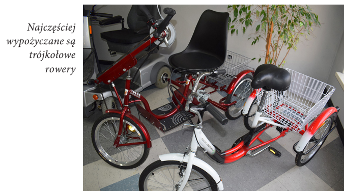
Najczęściej wypożyczane są trójkołowe rowery

Odbyły się cztery edycje spotkań, w których uczestniczyło 75 osób. Każde spotkanie kończyło się aktywnością fizyczną w postaci marszu nordic walking wokół Zalewu Arkadia. To świetny sposób by poprawić ogólną sprawność organizmu, oraz okazja do wspólnej integracji społeczności lokalnej. Uczestnikom zostały wydane dyplomy ukończenia szkolenia i zestawy kijków nordic walking, co daje dodatkową motywację do wyjścia z domu i integracji z sąsiadami oraz osobami poznanymi podczas szkolenia.