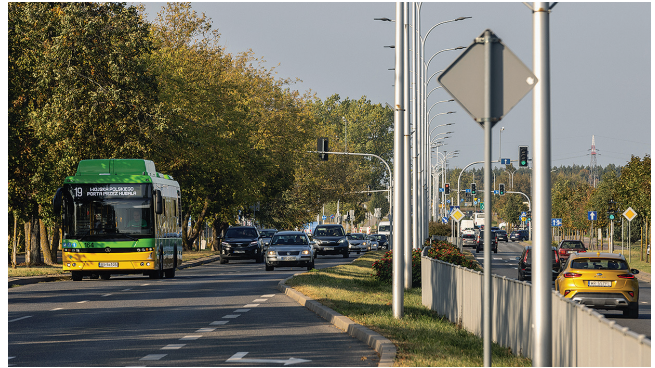
Ulica M. Reja to wciąż najbardziej ruchliwa arteria w mieście. Teraz kierowcy mają tutaj znacznie bezpieczniejsze i lepsze warunki do jazdy

Dziś nie wszyscy pamiętają, że jeszcze przed piętnastu laty ul. M. Reja była wąską, jednopasmową o szerokości kilku metrów jezdnią, na której trudno było wyminąć się, zwłaszcza po większych opadach śniegu. To była jedna z najbardziej ruchliwych ulic w Suwałkach, a jazda nią była koszmarem. Nic dziwnego, że na początku XXI wieku przebudowa ul. M. Reja była najbardziej oczekiwaną inwestycją miejską. Ulica została całkowicie przebudowana w latach 2009-2010. Na odcinku od ul. A. Wierusza-Kowalskiego do ul. Bulwarowej powstała dwupasmowa jezdnia, z oświetleniem i sygnalizacją świetlną. Przebudowano wszystkie skrzyżowania. Wartość przebudowy ok. 36 mln zł, z czego dofinansowanie z UE, wyniosło 90%. W kolejnych latach, też przy dofinansowaniu z funduszy UE przebudowano kolejne odcinki ul. M. Reja, od skrzyżowania z ul. A. Wierusza-Kowalskiego, do granic administracyjnych miasta w kierunku na Jeleniewo.