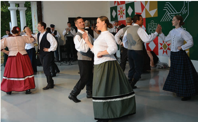
Tańce suwalskie zawsze były w repertuarze ZPiT „Suwalszczyzna”

– Nabory do „Suwalszczyzny” są ogłaszane na początku września, ale zawsze można do nas dołączyć! Ogłoszenia umieszczamy na oficjalnej stronie SOK-u oraz na portalach społecznościowych. Reprezentacja zespołu w strojach regionalnych osobiście odwiedza suwalskie szkoły i zaprasza do rodziny ZPiT „Suwalszczyzna”.