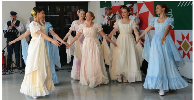
Na zakończenie obowiązkowo mazur

– Teraz zespół ma cztery składy: grupa dziecięca 8-10 lat – 18 osób; grupa juniorska 11-13 lat – 18 osób; reprezentacja – 20 osób; grupa byłych tancerzy – 10 osób oraz ośmioosobowa kapela. Tancerze w grupie reprezentacyjnej to uczniowie szkół średnich i osoby pracujące. W skład tej grupy wchodzi: księgowi, nauczyciele, agenci ubezpieczeniowi, technicy komputerowi i osoby posiadające własną działalność gospodarczą. To również emeryci zakochani od lat w zespole. Obecnie rodzina Suwalszczyzny to 70 osób.