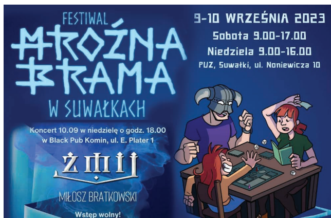
Wydarzenie organizowane we współpracy Stowarzyszenia Mroczne Bractwo i Państwowej Uczelni Zawodowej im. prof. Edwarda F. Szczepanika w Suwałkach