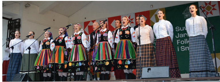
Przyśpiewki suwalskie w wykonaniu ZPiT „Suwalszczyzna”

Wśród tancerzy „Suwalszczyzny” nie brakuje przedstawicieli młodego pokolenia