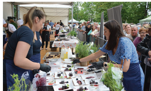
Zwycięska ekipa z Folwarku Hutta przygotowała: krem cukiniowo-miętowy z grzanką z serem, filet z jesiotra pod pierzynką maślano-pietruszkową, z musem z batatów i sosem burre blanc oraz browni z jeżyną, miętą i sosem owocowym

W pierwszy dzień zaprezentowano kulturę i muzykę ludową. Były koncerty zespołów muzycznych i wokalnie-tanecznych, a także kiermasz rękodzieła i lokalnych przysmaków oraz pokazy rzemiosł tradycyjnych. Kupić można było m.in. tradycyjne pieczywo, wyroby z mięsa, miód z lokalnych pasiek oraz oryginalne produkty sztuki ludowej i wyroby rękodzielnicze. Na scenie w muśzli koncertowej zaprezentowały się zespo-