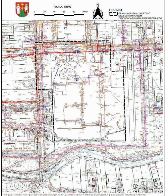
2026 g08203a projekt planu miejscowego: aktualizacja na mapie zasadniczej i poboczu województwa, w układzie współrzędnych PL 2000 (EPSG: 2181), z poboczeniem z planowego znanego, geodezyjnego i kartograficznego PL 2000, 1:600

http://bip.um.suwalki.pl/Menu_tematyczne/Zagospodarowanie_przestrzenne/informacja-dotyczaca-przetwarzania-danych-osobowych.html oraz w siedzibie Administratora - Wydział Architektury i Gospodarki Przestrzennej pok. 139.