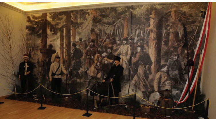
Wizualizacja bitwy pod Olszanką (10 kwietnia 1863 r.) z postaciami: kawalerzysty, piechura i żuawa wyposażonymi w oryginalną broń i akcesoria wojenne. Inscenizacja z wystawy Muzeum Okręgowego w Suwałkach w 150 rocznicę wybuchu Powstania Styczniowego

Powstanie styczniowe na Suwalszczyźnie zaczęło się później niż na innych ziemiach polskich. Według obliczeń władz rosyjskich do 28 kwietnia 1863 r. do powstania zbiegło stu mieszkańców Suwałk. Jak napisano w książce „Suwałki-miasto nad Czarną Hańczę” w kwietniu 1863 r. szef suwalskiej żandarmerii pisał, że: „na ulicach w Suwałkach nie spotkasz młodego człowieka, w zarządzie miejskim nie ma kto przepisywać papierów, w gimnazjum nie ma uczniów w czterech wyższych klasach(...)”. Mieszkańcy Suwałk nie widzieli walk powstańczych z wojskami rosyjskimi, nie słyszeli też zapewne odgłosów pola bitwy, gdyż do najbliższych potyczek doszło pod Żywą wodą, Krasnopolem i Olszanką.