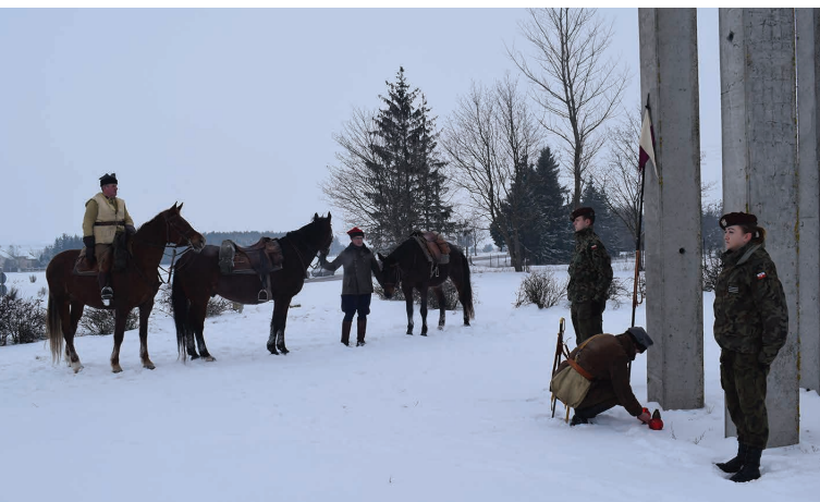
W 156 rocznicę powstania styczniowego pod pomnikiem na Górze Szubienicznej hołd powstańcom oddała Grupa Rekonstrukcyjna „Garnizon Suwałki” działająca przy suwalskim Muzeum Okręgowym

Do suwalskich szpitali przywożono rannych, a do odwachu i więzienia – pozostałych ujętych powstańców. Z Suwałk wychodziły lub przez nie przechodziły grupy skazanych na katorgę lub na inne kary odbywane w głębi Rosji.