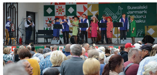
„Ze smakiem” zaprezentował się zespół „Suwańskie Starszaki”