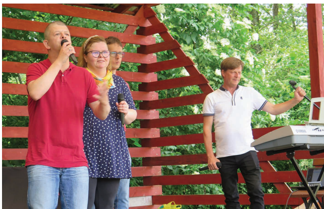
Zespół „Nadzieja” wystąpił w czasie czerwcowego pikniku integracyjnego w zespole pokamedulskim nad Wigrami

Zespół „Nadzieja” ma bogaty repertuar, starczy go do nagrania kolejnego krążka. Jego wydanie uzależnione jest jednak od zebrania odpowiedniej kwoty.