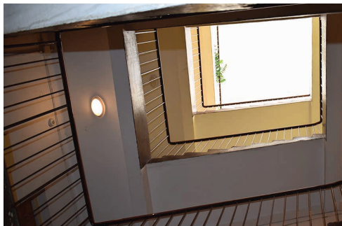
Tu będzie winda

Na tym osiedlu jest jeszcze pięć budynków (nr: 13, 14, 16, 20, 21) o identycznym układzie konstrukcyjnym klatki schodowej. W każdym z nich znajduje się 18-19 mieszkań. Obok pożyczek, możliwe jest uzyskanie dotacji z PFRON-u w wysokości do 180 tys. zł pod warunkiem, że w danym budynku w dwóch różnych lokalach na jednej klatce schodowej mieszkają przynajmniej 2 osoby z orzeczeniem o niepełnosprawności ruchowej.