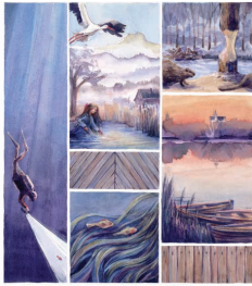
SIEDMIU BAŚNI O PODLASKIM malowanych pędzlem, WOCZYNIA HANIEŁA