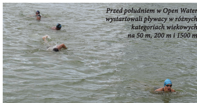
Przed południem w Open Water wystartowali pływacy w różnych kategoriach wiekowych na 50 m, 200 m i 1500 m

Ostatnia lipcowa niedziela nad Zalewem Arkadia upłynęła na sportowej rywalizacji. W jednym dniu, jednym miejscu rywalizowali pływacy i biegacze. Zawody zorganizowała Fundacja Teraz Wschód i suwalski Ośrodek Sportu i Rekreacji.