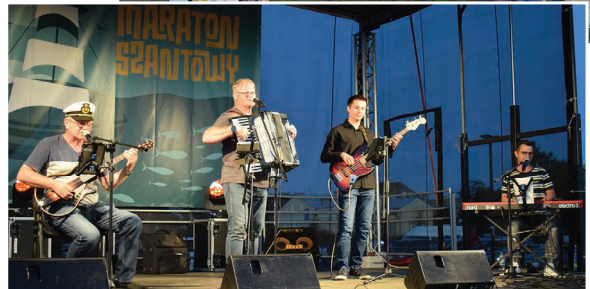
Zespół „Zmiana Wachty”

Wciąż nie brakuje u nas wielbicieli tego typu niezwykle brzmiącej muzyki, z prostymi i surowymi, ale nie pozbawionymi wdzięku tekstami. W tegorocznym maratonie wystąpiły suwalskie zespoły „Byle Dalej” i „Zmiana Wachty” oraz augustowski „Dobre Wrażenie”. Licznie zgromadzona publiczność bawiła się nie tylko przy pieśniach szantowych i balladach marynistycznych, ale i utworach z Krainy Łagodności z kręgu piosenki: literackiej, autorskiej, turystycznej, poezji śpiewanej.