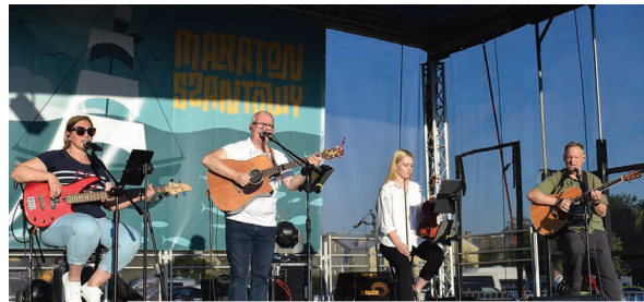
Zespół „Dobre wrażenie”

Na suwalskich Bulwarach, nad brzegiem Czarnej Hańczy w gorący sobotni wieczór 12 sierpnia odbył się Maraton Szantowy, który w Suwałkach jest organizowany od kilkunastu lat.