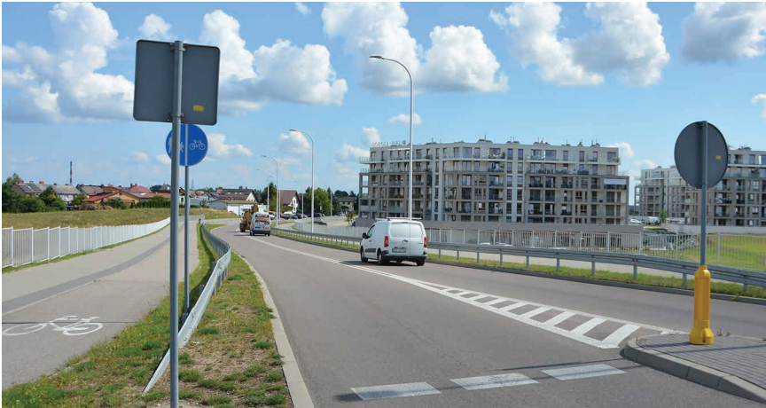
Od 1 września ulicą Aleksandry Piłsudskiej kursować będą autobusy komunikacji miejskiej nowej linii nr 23

Zmieni się również trasy kursowania empeków na terenie gminy Suwałki. Na wniosek władz gminnych autobusy miejskie będą jeździły do: Białej Wody, Wschodniego i Zielonego Kamedulskiego Osiedla.