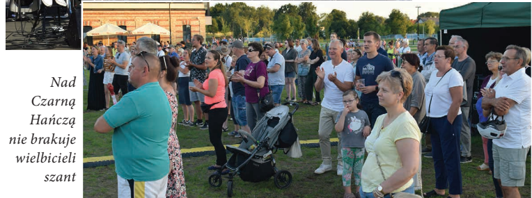
Nad Czarnej Hańczą nie brakuje wielbicieli szant