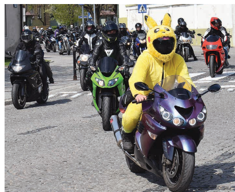
Suwałskimi ulicami przemknął „Pikachu”