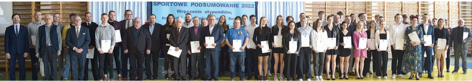
Nagrodzeni sportowcy, trenerzy i działacze z władzami miejskimi