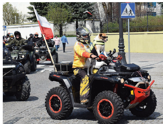
Pieski lubią nie tylko spacerować

reprezentować nasze miasto na wyjazdach i zlotach. W spotkaniu z motocyklistami wziął również udział przewodniczący Rady Miejskiej Zdzisław Przelomic.