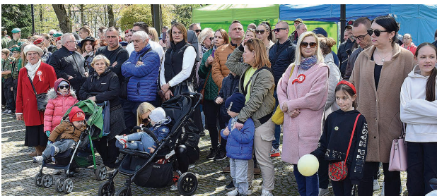
Suwalczanie licznie pojawili się na tegorocznych obchodach Święta Konstytucji 3 Maja