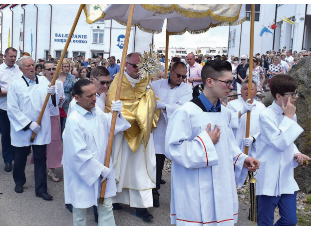
Procesja w Boże Ciało w 2021 r.

Z powodu niewystarczającej liczby kapłanów jestem zmuszony w pewnych parafiach zmniejszać ilość kapłanów. Jestem również przynaglony, aby niektóre parafie połączyć i to już w najbliższym czasie. Pragnę zapewnić, że parafia, w której na stałe nie będzie kapłana, nie pozostanie bez opieki duszpasterskiej. Oznacza to, że w każdą niedzielę i święta będą sprawowane Msze św. i sakrament pokuty. W takiej parafii nadal będzie przygotowanie i sprawowanie sakramentów: Pierwszej Komunii Świętej, bierzmowania czy sakramentu małżeństwa, a w pierwsze piątki miesiąca będą odwiedziny chorych.