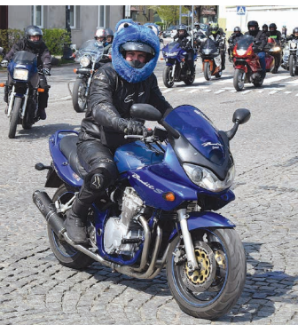
Zmotoryzowany „Ciasteczkowy Potwór”

29 kwietnia miłośnicy jednośladów z Suwałk i Suwalszczyzny oficjalnie zainaugurowali sezon mo-