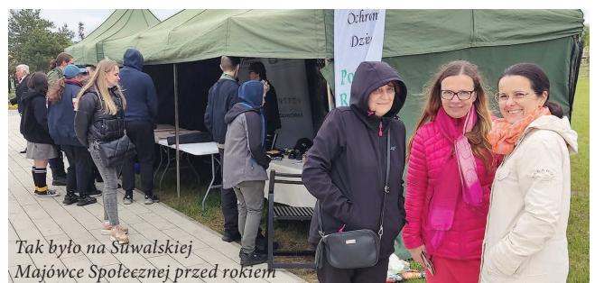
Tak było na Suwalskiej Majówce Społecznej przed rokiem

Na V Suwalską Majówkę Społeczną zapraszają w sobotę 13 maja w godzinach 10-15 na bulwary przy Galerii Sztuki Stara Łaźnia Miasto Suwałki i suwalskie organizacje pozarządowe. Spotkanie będzie okazją do dorocznej prezentacji organizacji pozarządowych i spotkania osób zainteresowanych działalnością społeczną. Na stoiskach przy Łaźni spotkać będzie można najaktywniejszych społeczników w naszym mieście i być może także przyłączyć się do ich inicjatyw. Chętni mogą wziąć udział w przygotowanych przez nie atrakcjach, np. zagrać w szachy plenerowe, wziąć udział w wyścigu na rowerach stacjonarnych, przyglądać się treningowi aikido i nauczyć, jak zrobić bombę kwiatną. W plenerze zaprezentują się także artyści, m.in. seniorzy ze Stowarzyszenia Seniorzy z Pasją Horyzont w koncercie pt. „Nic bez miłości”.