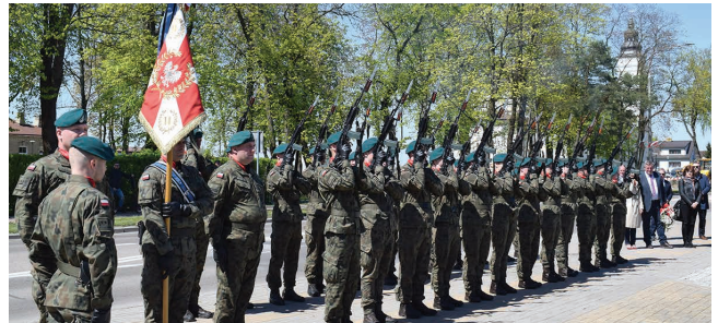
Salwa honorowa w wykonaniu żołnierzy 14 Pułku Przeciwpancernego im. Marszałka J. Piłsudskiego w Suwałkach