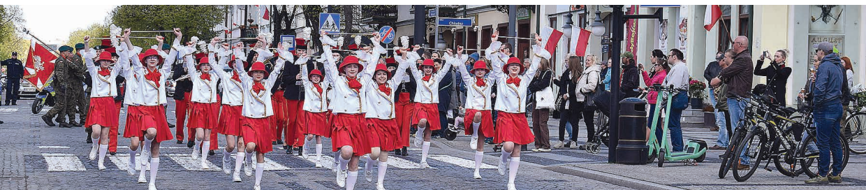
Spod konkatedry pw. św. Aleksandra uczestnicy obchodów Święta Konstytucji 3 Maja prowadzeni przez mażoretki z Suwalskiego Ośrodka Kultury przemaszerowali do parku Konstytucji 3 Maja

W TYM ROKU 3 MAJA SUWALCZANIE OBCHODZILI DWIE ROCZNICE. OBCHODZILI 232 ROCZNICĘ UCHWALENIA KONSTYTUCJI 3 MAJA ORAZ SETNĄ ROCZNICĘ POSADZENIA DĘBU WOLNOŚCI, PATRIOTYCZNEGO SYMBOLU MIASTA. O DĘBIE WOLNOŚCI PISALIŚMY WIĘCEJ W POPRZEDNIM WYDANIU „DWUTYGODNIKA SUWALSKIEGO”.