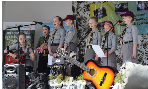
Na scenie „Greckie duszki” z suwańskiego Hufca ZHP

Suwański Hufiec ZHP im. Tadeusza Lutostańskiego 2 maja w parku Konstytucji 3 Maja zorganizował Festiwal Piosenki Harcerskiej i Turystycznej „Garbasiowa sosenska”. Zespoły zachów i harcerzy śpiewały piosenki autorskie, jak i szlagiery harcerskie i turystyczne. Jury zwróciło uwagę na oryginalne nazwy podmiotów artystycznych np. „Greckie duszki” czy „Podkalibrowy Pocisk Przeciwpancerzy” w skrócie „PPP”. Wszyscy wykonawcy w nagrodę otrzymywali sadzonki sosny.