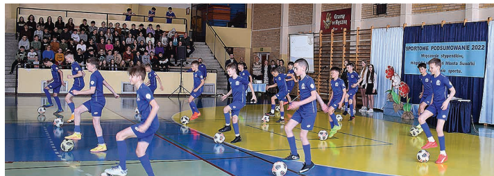
Swoje umiejętności zaprezentowali młodzi sportowcy z SP nr 11

– 8 wyróżnień w kategorii: zawodnik – 4 osoby, inna osoba fizyczna – 4 osoby.