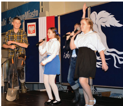
Uczniowie SP nr 4 przypomnieli krótką historię swojej szkoły

– Suwalska „czwórka” to szkoła, która przeżywa teraz swego rodzaju renesans. Z kilku powodów. Przede wszystkim z uwagi na zainteresowanie placówką. Południowa część Suwałk, która mocno się rozbudowuje, skutkuje w efekcie większą liczbą młodych osób, które są zainteresowane nauką w tej placówce – powiedział w swoim przemówieniu prezydent Suwałk Cz. Renkiewicz.