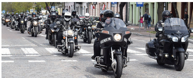
Suwałscy „Easy Riders”

29 kwietnia miłośnicy jednośladów z Suwałk i Suwalszczyzny oficjalnie zainaugurowali sezon mo-