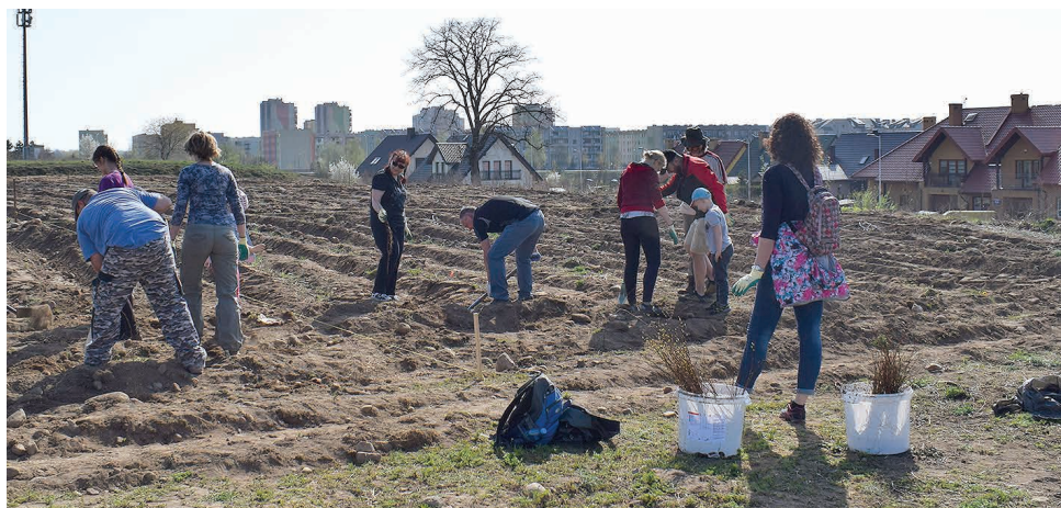
Firma CAL sfinansowała zakup drzewek, które zostały zasadzone za osiedlem przy ul. Franciszkańskiej w kwietniu 2019 r.

– Jestem przekonana, że nie żyjemy wyłącznie dla siebie. Wierzę, że człowiek potrzebuje poczucia wspólnoty. CAL społeczną odpowiedzialność biznesu ma w DNA firmy. Zaczyna się ona od produkcji drzwi, które są ekologiczne i które mogą być odnawiane (naszym klientom oferujemy „Klinikę Drzwi”). Naszą odpowiedzialność wobec pracowników potwierdza fakt, że przyprawdzają oni do pracy u nas swoje dorosłe już dzieci.