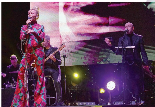
Na scenie w Suwałki Arenie zaprezentowała się Anna Wyszconi, znana z wykonania takich piosenek jak „Czy ten pan i pani”, „Oszukać los” czy „Mimochodem”