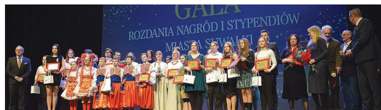
Suwalscy laureaci nagród i stypendiów w dziedzinie twórczości artystycznej i upowszechniania kultury z władzami Suwałk