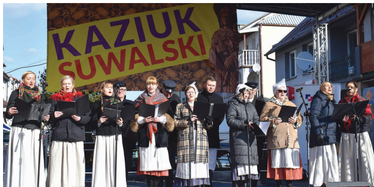
Zespół śpiewaczy Ancyjas działający przy Suwałskim Ośrodku Kultury