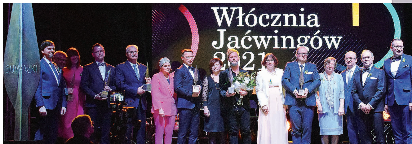
Laureaci „Włócznie Jaćwingów” z suwańskimi władzami miejskimi