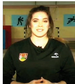
przebywała na zgrupowaniu w Portugalii

Wychowanka Lekkoatletycznego Uczniowskiego Klubu Sportowego „Hańcza” Suwałki. Zdobywczyni srebrnego medalu XXXII Letnich Igrzysk Olimpijskich w Tokio. Podczas Pucharu Europy, który odbył się w chorwackim Splicie, osiągnęła trzeci wynik w historii lekkoatletyki – oddała rzut oszczepem na odległość 71,40 m. Lokalna patriotka, zawsze podkreślająca skąd pochodzi. Wyróżniona podczas gali European Athletics Golden Tracks 2021 w Lozannie. Wspomogła zbiórkę pieniędzy na operację poważnej wady serca cierpiącego chłopca, oddając na licytację medal olimpijski. W 87 Plebiscycie Przeglądu Sportowego