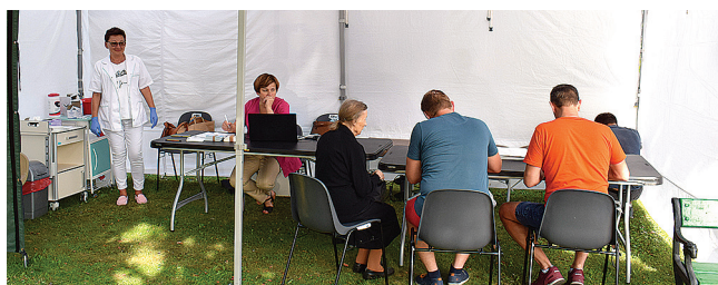
Wszyscy chętni w czasie Jarmarku Kamedulskiego mogli zaszczepić się przeciw COVID-19