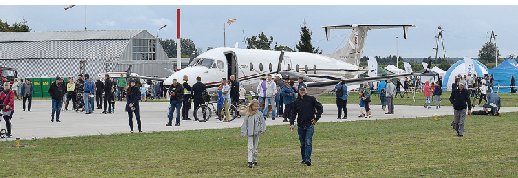
Uczestnikami festynu były setki suwalczan i turystów