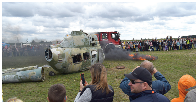
Zainteresowaniem cieszyły się pokazy akcji gaśniczej zrealizowane przez Komendę Miejską Państwowej Straży Pożarnej w Suwałkach

Dużym zainteresowaniem cieszyły się skoki spadochronowe i wejścia do tunelu aerodynamicznego. Chętnych do skorzystania z ofert nie brakowało i stali oni w kilkugodzinnych kolejkach.