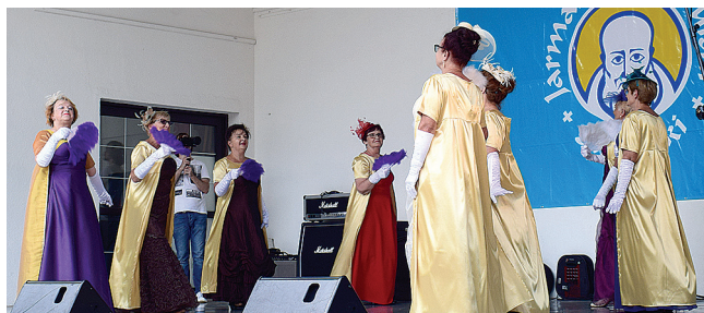
Na scenie zaprezentował się suwalski zespół „Srebrne Pierwioski”

W niedzielę w Parku Konstytucji 3 Maja poza kiermaszem pojawiła się rodzinna strefa zabaw dla dzieci oraz stoiska lokalnych twórców, artystów i stowarzyszeń kulturalno-artystycznych. Najmłodszy obejrzał Niedzielną Poranek Teatralny i wzięli udział w specjalnie dla nich przygotowanych animacjach. Oprócz zakupów i degustacji, można było obejrzeć występy lokalnych artystów. Na scenie pojawili się między innymi, Zespół Pieśni i Tańca Suwalszczyzna, Suwałki Gospel Choir, zespoły „Suwalskie Starszaki” i „Srebrne Pierwioski”, a także dzieci i młodzież z zespołów FLEX, DOTYK, RADOŚĆ, Studia Piosenki ŚWIETLIK oraz młodzi muzycy z pracowni muzycznych SOK.