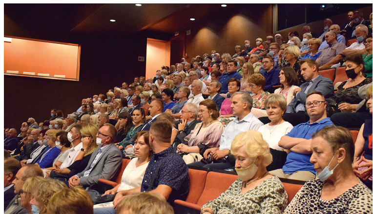
Liczni widzowie z zainteresowaniem oglądali występy artystyczne towarzyszące wręczeniu nagród Włócznia Jaćwingów