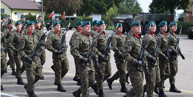
Na placu apelowym odbyła się defilada pododdziałów suwałskiego pułku

Oficjalne uroczystości odbyły się na placu apelowym 14. Suwałskiego Pułku Artylerii Przeciwpancernej. Były mianowania na wyższe stopnie wojskowe, odczytano Apel Pamięci Oręża Polskiego i oddano salwę honorową.