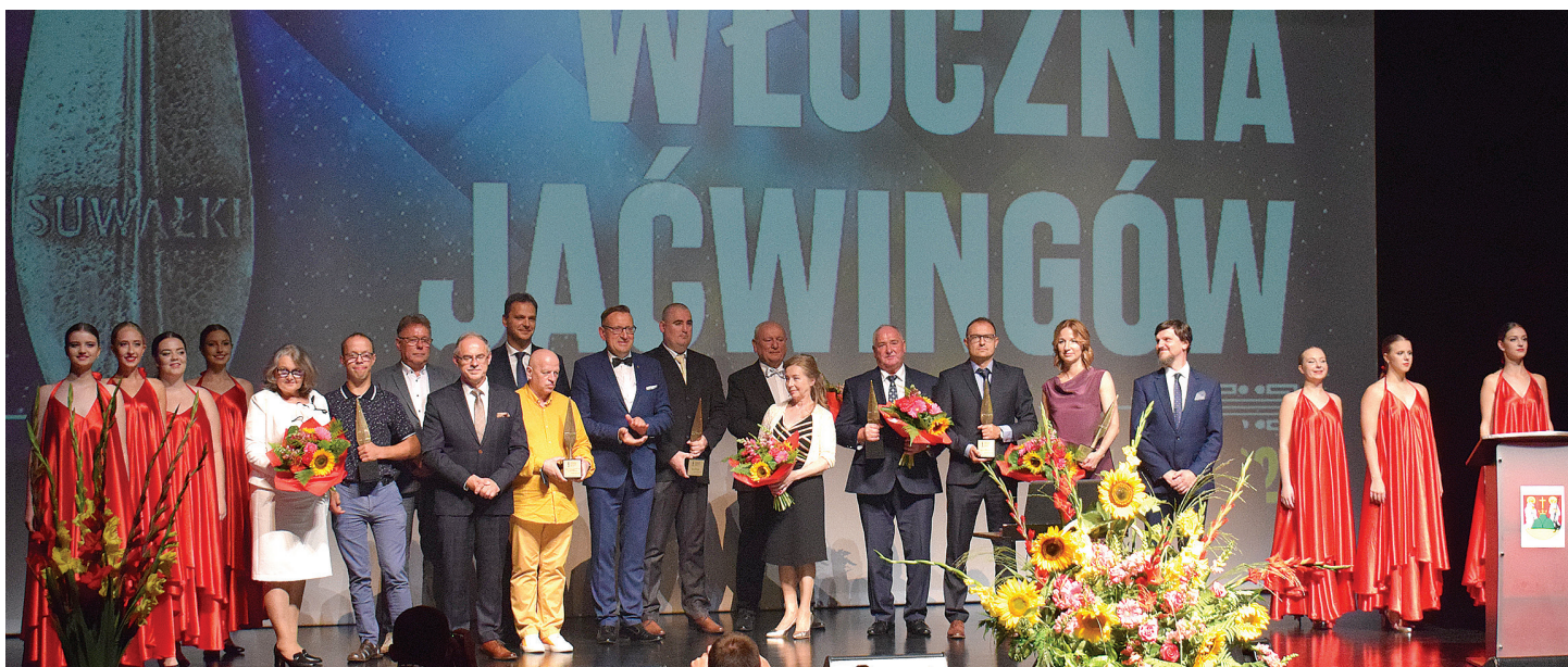
Lauraci Włócznia Jaćwingów 2020 wraz z osobami wręczającymi