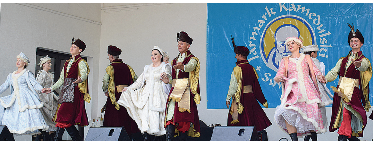
Na scenie muszli koncertowej Zespół Pieśni i Tańca Suwalszczyzna

W niedzielę w Parku Konstytucji 3 Maja poza kiermaszem pojawiła się rodzinna strefa zabaw dla dzieci oraz stoiska lokalnych twórców, artystów i stowarzyszeń kulturalno-artystycznych. Najmłodszy obejrzał Niedzielną Poranek Teatralny i wzięli udział w specjalnie dla nich przygotowanych animacjach. Oprócz zakupów i degustacji, można było obejrzeć występy lokalnych artystów. Na scenie pojawili się między innymi, Zespół Pieśni i Tańca Suwalszczyzna, Suwałki Gospel Choir, zespoły „Suwalskie Starszaki” i „Srebrne Pierwioski”, a także dzieci i młodzież z zespołów FLEX, DOTYK, RADOŚĆ, Studia Piosenki ŚWIETLIK oraz młodzi muzycy z pracowni muzycznych SOK.