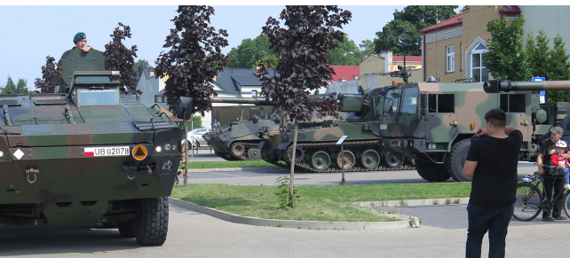
Suwałczanie mogli obejrzeć najnowszy sprzęt będący na wyposażeniu suwałskiego pułku – KTO Rosomak-S

Mieszkańcy miasta mogli skorzystać z mobilnego punktu szczepień wspieranego przez punkt NFZ z Białegostoku promujący szczepienia oraz profilaktykę badań osób po 40 roku życia. Można było też skorzystać ze strzelnicy broni pneumatycznej. Dla najmłodszych przygotowano liczne atrakcje w postaci strefy dmuchańców, animatora, malowania twarzy oraz gier i zabaw edukacyjno-historycznych i taktycznego toru przeszkód. A kto zgłodniał, mógł spróbować wojskowej grochówki.