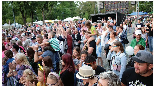
Gromkim „sto lat” suwałczanie podziękowali M. Andrejczyk za wspaniałe emocje jakie przeżyliśmy w czasie jej startu w Tokio