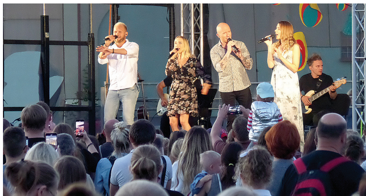
Warszawski zespół Accantus Live Band wykonał covery filmowe i utwory musicalowe