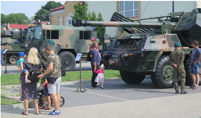
Żołnierze z Węgorzewa zaprezentowali armatohaubicę 152 mm DANA

Piknik wojskowy zorganizowano przy Starej Łażni. Zaprezentowała się orkiestra wojskowa garnizonu Giżycko. Były stoiska promocyjne różnych formacji wojskowych: 14 pppanc, 18 pplot, 11 pa, 15 BZ, 12 blp oraz służb mundurowych. Można było obejrzeć pokaz statyczny sprzętu wojskowego będącego na wyposażeniu 14 pppanc oraz jednostek wchodzących w skład 16 DZ. WKU w Suwałkach prowadziło punkt rekrutacyjny do zawodowej służby wojskowej.