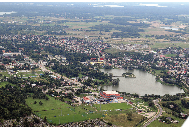
W trakcie festynu udostępniono bogatą ofertę lotów widokowych samolotem Cessna 206 i Cessna 182

Organizatorami Festynu Lotniczego „ODLOTOWE SUWAŃKI” byli: Miasto Suwałki, Zarząd Dróg i Zieleni w Suwałkach, Ośrodek Sportu i Rekreacji w Suwałkach, Suwalska Szkoła Lotnicza, Komenda Miejska Państwowej Straży Pożarnej w Suwałkach, zaś partnerem wydarzenia był Aeroklub Krainy Jezior.