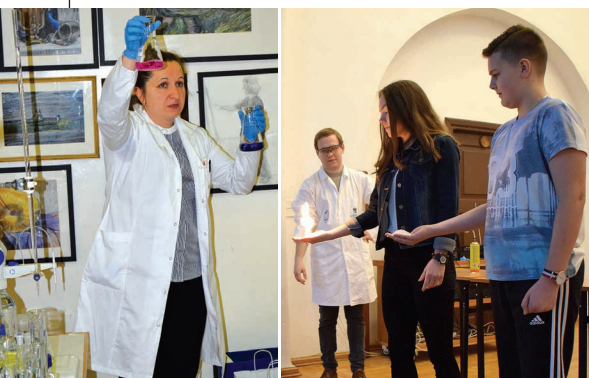
ciekawe eksperymenty chemiczne – w tym widowiskowe pokazy pirotechniczne, przeprowadzili reprezentanci Naukowego Koła Chemików Uniwersytetu im. A. Mickiewicza w Poznaniu

Więcej na: ww.dwutygodniksuwalski.pl i www.um.suwalski.pl