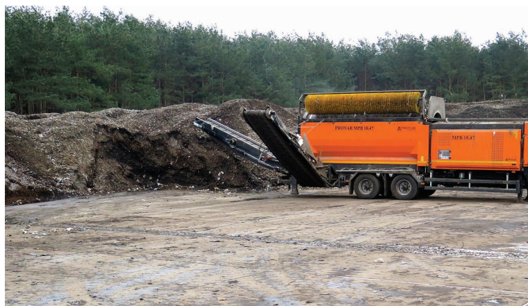
Bioodpady po przetworzeniu stają się kompostem, który przechowywany jest na utwardzonym placu