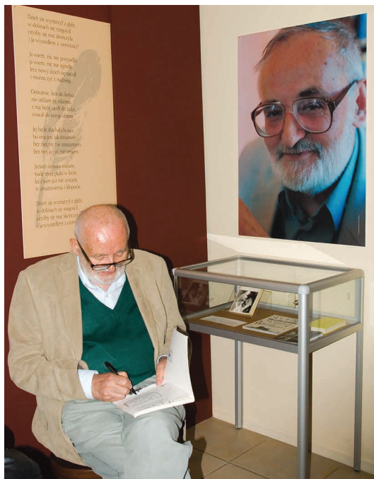
W Muzeum im. Marii Konopnickiej, 12 czerwca 2013 roku

Z tomiku „Odwitania z Suwalszczyzną” 1989 r.