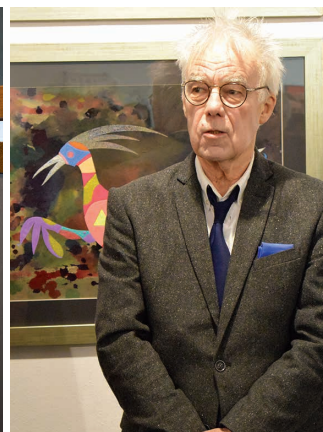
Czy to były płótna mistrza Jana, czy Kantego – śpiewał przed prawie półwieczem Marek Grechuta. Tej wątpliwości nie mieli suwalczanie, który odwiedzili suwalską galerię w czasie wernisza wystawy „Sensy Byty Mary” Jana Kantego Pawluśkiewicza

z suwalskiego Muzeum Okręgowego. Krakowski artysta przyznał, że maluje od zawsze. Choć raz pierwszy wystawił swoje obrazy dopiero w 1999 r. w Piwnicy pod Baranami. Od tego czasu zaprezentował wiele serii obrazów, rysunków i grafik. Na koncie ma ponad 70 wystaw indywidualnych w kraju i za granicą.