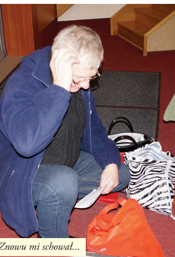
Znowu mi schował...