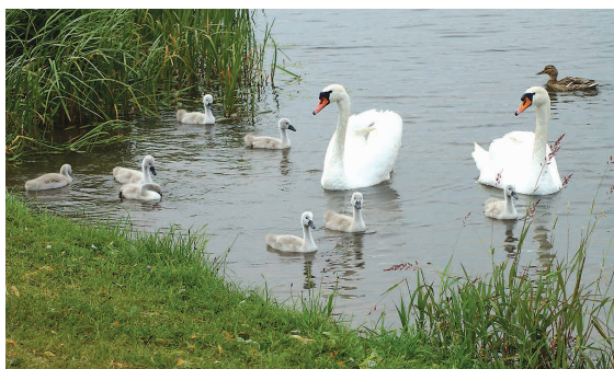
Wielodzietna rodzina nad zalewem Arkadia