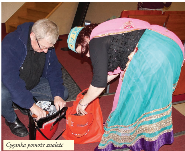
Cyganka pomoże znaleźć

słuchawkę i otwieram drzwi wejściowe roznosicielowi ulotek. Zaraz – no i co ja miałam zrobić? Zwyczajnie zapomniałam... Sytuację ratuje tym razem trzymana w ręce butelka z wodą. Aha! – kierunek łazienka i odżywka. Ale tu – nowe odkrycie: na półce, oparta o kartonik z odżywką, stoi saszetka, zawierająca maseczkę do rąk. Kilka dni temu zupełnie nie mogłam jej znaleźć! No tak, teraz położę ją w dobre miejsce. Idę do sypialni po kosmetyczkę. Zerkam do lustra, obok którego przechodzę! O matko, przecież ja się dzisiaj nie uczesałam! Więc siadam przed tym lustrem i się czeszę. No, no..., jeszcze całkiem nieźle wyglądam! Zadowolona wracam do pracy przy komputerze. I wtedy kolejny raz przypominam, że tego leku, tego cholernego leku wciąż nie zażyłam! Tym razem zła na lek, na siebie i na cały świat idę do kuchni po raz