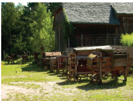
Wystawa etnograficzna „Ocalić od zapomnienia”

Wystawa przyrodnicza „Nad Wigrami” i wystawa etnograficzna „Ocalić od zapomnienia” w Krzywym oraz wypożyczalnia rowerów czynna w godz. 9-16. Rejsy łodzią Leptodora II – Stary Folwark Muzeum Wigier o godz. 10.00, 11.00, 13.00, 14.00, 15.00. Muzeum Wigier czynne 9-16.