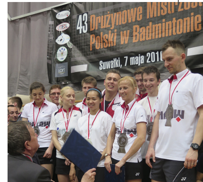
Przed rokiem badmintoniści SKB Litpol-Malow cieszyli się z mistrzostwa wywalczonego w Suwałkach

godz. 17.00 mecz o pierwsze miejsce – SKB „LITPOL-MALOW” Suwałki – UKS „Hubal” Białystok