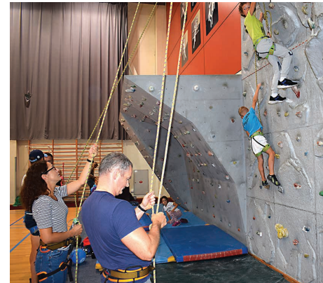
Każdy mógł spróbować swoich sił na ścianie wspinaczkowej

Na sportowo pożegnali wakacje suwalczanie w hali sportowej przy ul. Wojska Polskiego. Po raz szósty suwański Ośrodek Sportu i Rekreacji przygotował bogaty program rozrywek dla całych rodzin. Były rodzinne rozgrywki sportowe, zabawy dla rodziców, dzieci i młodzieży. Starsi miłośnicy piłki nożnej mieli niepowtarzalną okazję wziąć udział w warsztatach dryblingów prowadzonych przez łódzką grupę „Mekka Street”. Ponadto odbyły się pokazy freestyle football oraz Panna Show, czyli gra na siaty.