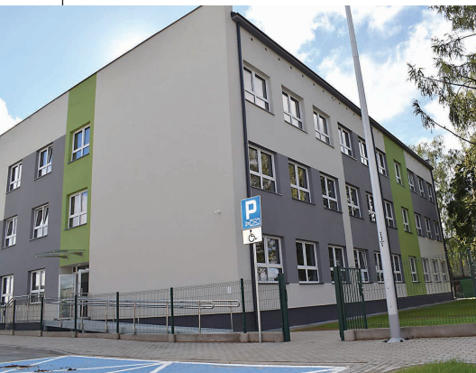
Nowy budynek SP nr 4 prezentuje się okazale. To pierwszy nowy szkolny obiekt w Suwałkach od piętnastu lat

Zimowa przerwa świąteczna potrwa od 23 do 31 grudnia 2020 r., a uczniowie wrócą do szkół dopiero w poniedziałek – 4 stycznia. Ferie zimowe dla województwa podlaskiego: 25 stycznia – 7 lutego 2021 r. Przerwa świąteczna wielkanocna potrwa 6 dni – od czwartku 1 kwietnia do wtorku 6 kwietnia 2021 r. Zakończenie roku szkolnego 2020/2021 zaplanowano na 25 czerwca 2021 r., a wakacje mają trwać do 31 sierpnia 2021 r.