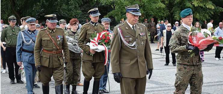
Kwiaty składają przedstawiciele wojska oraz grup rekonstrukcyjnych