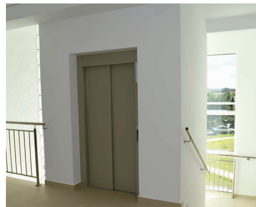
Nowy budynek SP 4 w całości dostosowany jest do potrzeb osób niepełnosprawnych. Znajdują się w nim: winda, dostosowane łazienki, dwie schody

Zimowa przerwa świąteczna potrwa od 23 do 31 grudnia 2020 r., a uczniowie wrócą do szkół dopiero w poniedziałek – 4 stycznia. Ferie zimowe dla województwa podlaskiego: 25 stycznia – 7 lutego 2021 r. Przerwa świąteczna wielkanocna potrwa 6 dni – od czwartku 1 kwietnia do wtorku 6 kwietnia 2021 r. Zakończenie roku szkolnego 2020/2021 zaplanowano na 25 czerwca 2021 r., a wakacje mają trwać do 31 sierpnia 2021 r.