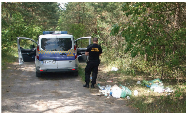
Nielegalne wysypisko śmieci na obrzeżach miasta

Mało kto dzisiaj pamięta, że na początku lat 90-tych ubiegłego wieku w naszym mieście „kwitł” handel w różnych miejscach. Po sprzedających pozostawały tony śmieci. Dbając o estetykę, suwalczy radni miejscy określili miejsca przeznaczone do handlu, a strażnicy otrzymali zadanie likwidowania nielegalnych miejsc handlu. Często sprzedawcy dobrowolnie