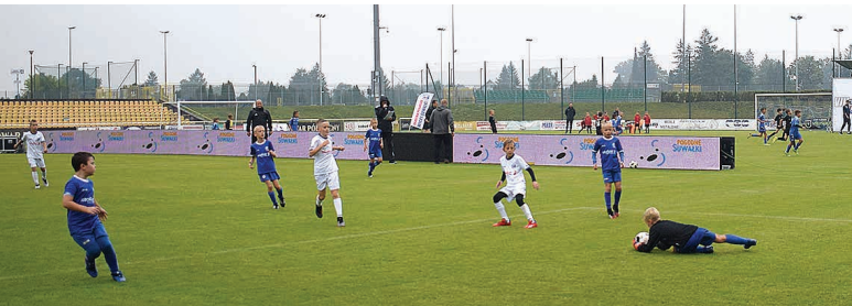
W meczu dwóch drużyn Akademii Piłkarskiej Wigry Suwałki wygrali piłkarze z rocznika 2011, chociaż dużą wolą walki wykazali się również ich młodszy koledzy