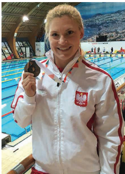
Niemalże z każdego mistrzostw Polski, Europy i świata oraz Igrzysk Paraolimpijskich J. Mendak powracała z medalami

– Ostatni czas dla wielu z Nas był okresem zdecydowanego spowolnienia... ja mu-