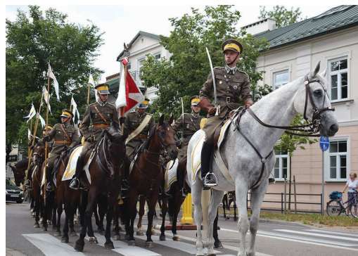
Po 81 latach ponownie szwoleżerowie pojawili się na suwalskich ulicach

zasługi na rzecz upowszechniania wiedzy historycznej. Organizatorem uroczystości było suwalskie Muzeum Okręgowe, a współfinansował je samorząd miejski.