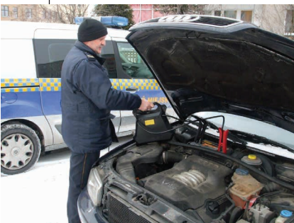
Strażnicy zimą pomagają uruchamiać samochody mieszkańcom miasta

Telefon alarmowy 986. Straż Miejska pracuje w systemie dwuzmianowym od poniedziałku do soboty w godzinach 6.30-22. W roku 2019 wpłynęło 3 557 zgłoszeń, którymi zajęli się suwalscy strażnicy. W tym roku w związku ze stanem epidemii (COVID-19) z polecenia Wojewody Podlaskiego od 2 kwietnia do 18 czerwca, Straż Miejska w Suwałkach była podporządkowana komendantowi Miejskiemu Policji. W tym czasie strażnicy zajmowali się m.in. kontrolą osób przebywających na kwarantannie, ale zdarzało się też konwojować na badanie osoby, które miały niepokojące objawy. Funkcjonariusze łącznie na tych służbach spędzili prawie dwa i pół tysiąca godzin.