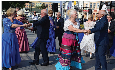
Zespół taneczny wykonał: poloneza, kujawiaka i mynek suwalski

Wspólne śpiewanie pieśni patriotycznych zaproponowali suwalczanom seniorzy na 300-lecie uzyskania praw miejskich Suwałk i w 101. rocznicę wyzwolenia Suwałk. Na Placu Marii Konopnickiej wystąpiły zespoły ze Stowarzyszenia Seniorzy z Pasją HORYZONT: wokalny „Ocean Życia”, wokально-instrumentalny „Cantabile” i taneczny „Diament”. Wspólnie śpiewano m.in. „Marsz, marsz Polonia”, „Szara piechota” i „Rozszumiały się wierzyby płaczące”. Z kolei zespół „Suwalskie Starszaki” zaprezentował piosenki folkloru miejskiego w suwalskich realiach pod hasłem „Na Gnojnjej w Suwałkach bawimy się”.