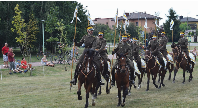
Jazda w szyku dwójkowym nad Zalewem Arkadia

W Suwałkach obchodzono setną rocznicę 3. Pułku Szwoleżerów Mazowieckich im. płk Jana Kozieltulskiego. 21 sierpnia na Placu Marii Konopnickiej otwarto plenerową wystawę poświęconą suwalskim szwoleżerom. A następnego dnia na placu nad Zalewem Arkadia swoje umiejętności zaprezentowali kawalerzyści ze Szwadronu Honorowego. Następnie przed konkatedrą pw. św. Aleksandra odprawiono mszę św., po której kawalerzyści przemaszerowali ulicami Suwałk na teren byłych koszar 3. Pułku Szwoleżerów Mazowieckich im. płk. J. Kozieltulskiego przy ul. Sejneńskiej, gdzie odsłonięto jubileuszową tablicę upamiętniającą pułkowych żołnierzy.