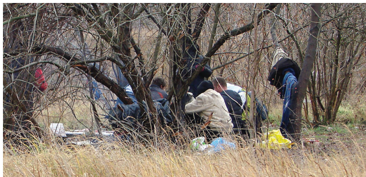
Straż Miejska często udziela pomocy bezdomnym i osobom pod wpływem alkoholu

ców naszego miasta. Strażnicy miejscy dysponują m.in.: 2 samochodami służbowymi, 2 rowerami służbowymi, środkami radiowej łączności, urządzeniem rozruchowym do samochodów, dronem, środkami przymusu bezpośredniego, środkami technicznymi służącymi do obserwowania i rejestrowania zdarzeń w miejscach publicznych. Dwóch strażników jest delegowanych do obsługi centrum obserwacji i rejestracji (42 kamery miejskie), znajdującym się w suwalskiej Komendzie Miejskiej Policji. W ostatnich latach w suwalskiej Straży Miejskiej nie doszło do żadnych przypadków naruszenia dyscypliny pracy. Nie odnotowano też żadnego wypadku nadzwyczajnego z udziałem strażników. Nie wpłynęła żadna skarga na działania strażników wymagająca wyjaśnienia bądź innych form ustaleń w trybie postępowania administracyjnego.