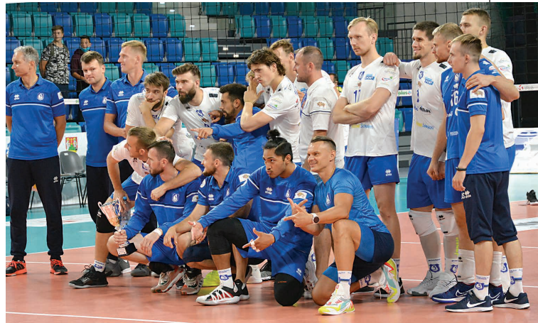
Ślepsk Malow Suwałki w nowym składzie ze sztabem szkoleniowym