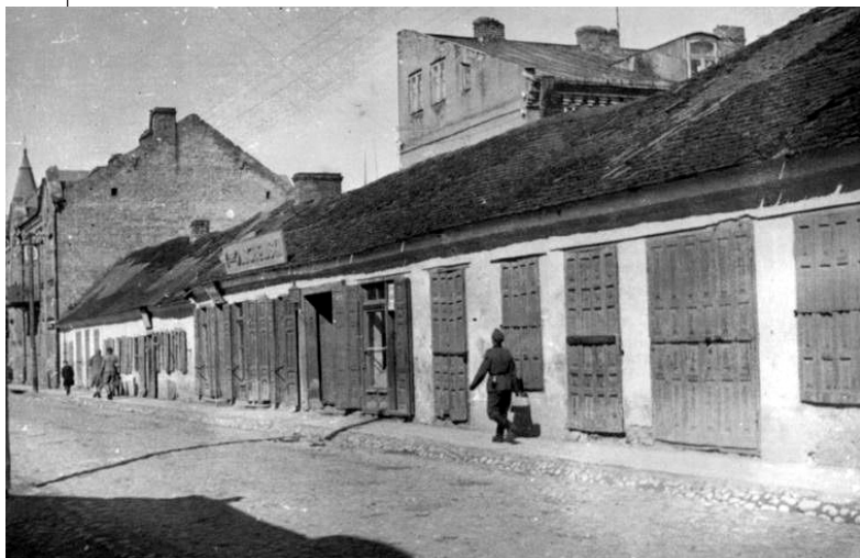
Druga wojna światowa. Zdjęcie zrobione w 1940 roku na obecnej ulicy Waryńskiego.