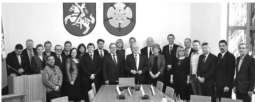
Pamiątkowe zdjęcie gospodarzy i gości

Akt Przywrócenia Państwa Litewskiego lub Akt 11 marca to deklaracja niepodległości przyjęta przez Litewską Socjalistyczną Republikę Radziecką. Została ona uchwalona 11 marca 1990 roku i podpisana przez wszystkich członków Rady Najwyższej Republiki Litewskiej. Akt podkreślał odnowienie i prawną kontynuację państwa litewskiego z okresu międzywojennego, które znalazło się pod okupacją Związku Radzieckiego i utraciło niepodległość w czerwcu 1940 roku. Litwa, jako pierwsza