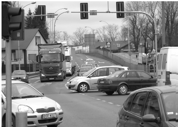
Utrata zatłoczona jak zawsze