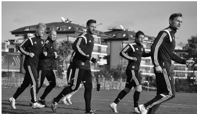
Piłkarze ostro trenowali