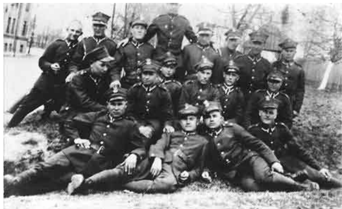
Żołnierze 41. Suwańskiego Pułku Piechoty w Grodnie. Zdjęcie zrobione w maju 1936 roku