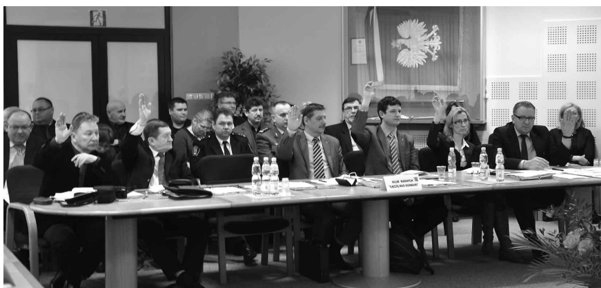
Głosują radni klubu „Łączą nas Suwałki”

Krytykę wzbudza też zapis w sejmowej ustawie, który wymusza na samorządach organizowanie otwartych przetargów na odbiór śmieci, co często oznacza straty dla miejskich przedsiębiorstw komunalnych. Mówił o tym poseł opozycji Jarosław Zieliński , zastrzeżeń do zapisów ustawy nie kryła posłanka koalicji rządzącej Bożena Kamińska .