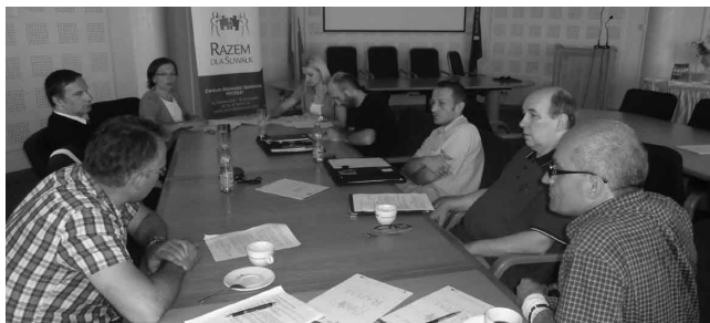
Konsultacje społeczne w urzędzie miasta

Konsultacje społeczne to proces, w którym przedstawiciele władz (na poziomie lokalnym lub centralnym) przedstawiają mieszkańcom i ich organizacjom swoje plany dotyczące np. uchwalenia lub zmiany aktów prawnych, podjęcia się realizacji konkretnej inwestycji lub innych przedsięwzięć, które będą miały wpływ na życie codzienne i pracę obywateli.