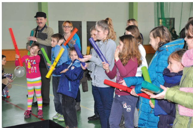
Dzieci utworzyły orkiestrę i kolorowymi pałkami wystukiwały rytm prostych melodii