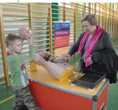
Można było „rozłożyć człowieka na części” albo zawiesić piłeczkę w powietrzu na dowolnej wysokości