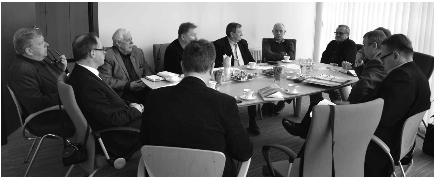
Spotkanie odbyło się w siedzibi aquaparku