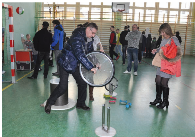
Na wirującym krześle chętnie siadali także dorośli