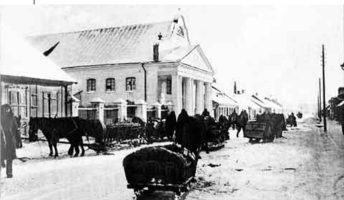
Wielka Synagoga w Suwałkach, zniszczona w 1956 r., obecnie ul. Noniewicza i teren Osiedla II Main Synagogue in Suwałki, taken apart in 1956, currently Noniewicza Street and grounds of District II

Klasycystyczna synagoga, otynkowana i pomalowana na jasny kolor, zbudowana na planie prostokąta o wymiarach ok. 30x15m, stanowiła sakralną budowlę o bardzo ciekawej architekturze i była jednym z najcenniejszych zabytków kultury żydowskiej. Służyła w okresie międzywojennym Żydom, którzy w Suwałkach stanowili ok. 30 proc. ludności miasta.