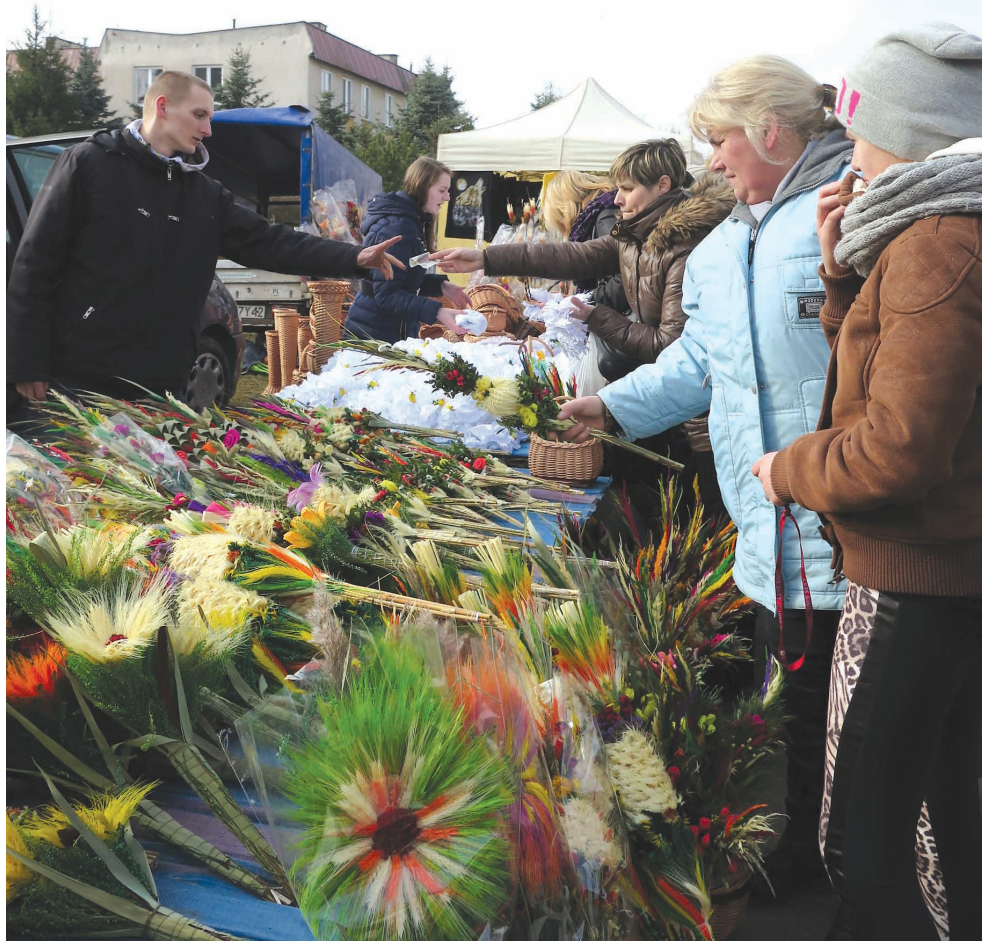
Więcej str. 19