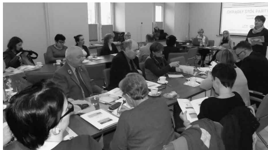
Okragły Stół Partycypacyjny

– programu współpracy Miasta Suwałki z organizacjami pozarządowymi oraz podmiotami, o których mowa w art.3 ust.3 ustawy o działalności pożytku publicznego i o wolontariacie – (zgłoszono 38 uwag);